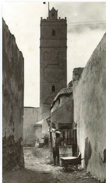
Agadir (Maroc), années 1930 (AMBC, 60 NUM 6 – don de Serge Verheylewegem).