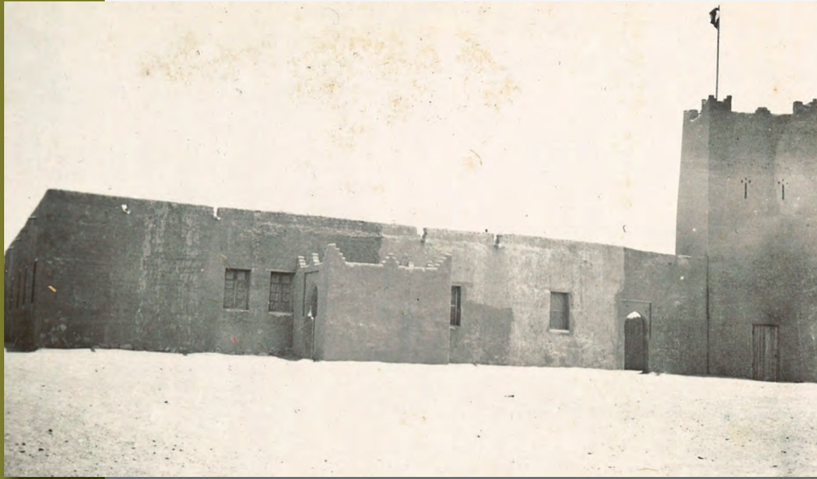
Fort de Tindouf (Algérie), 1936.