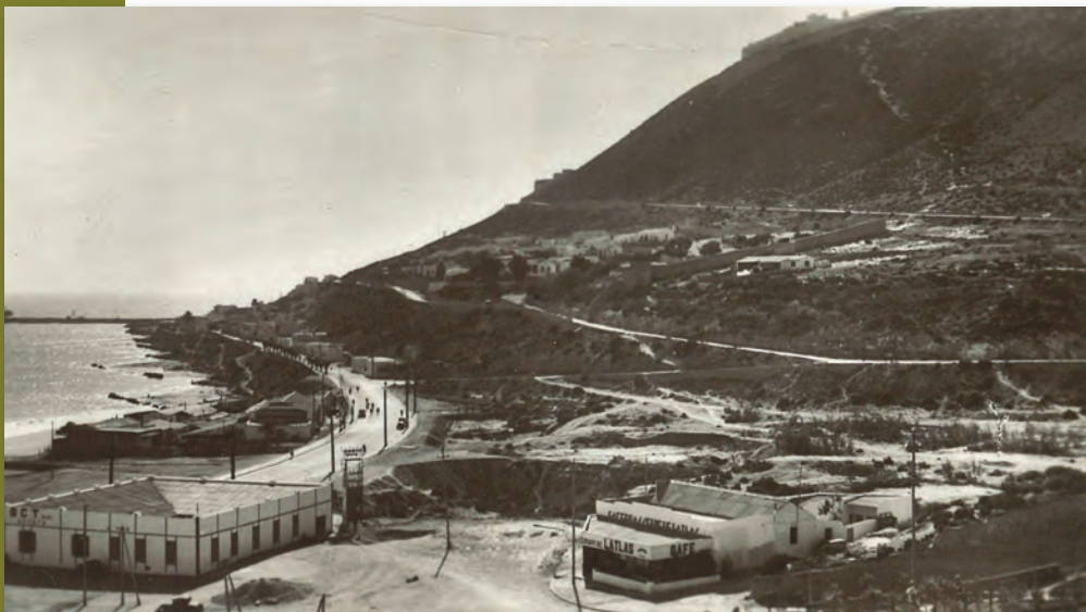
Agadir (Maroc), années 1930 (AMBC, 60 NUM 6 – don de Serge Verheylewegem).