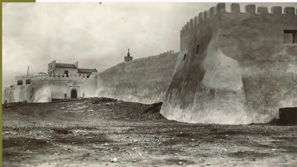
Fort d'Agadir (Maroc), années 1930 (AMBC, 60 NUM 6 – don de Serge Verheylewegem).