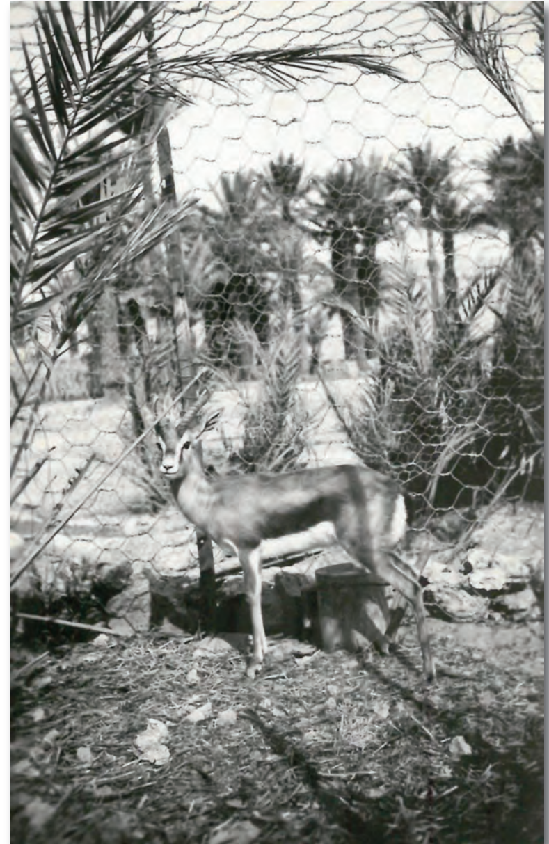
Tindouf (Algérie), 1935 (AMBC, 60 NUM 9 - don de Serge Verheylewegem).