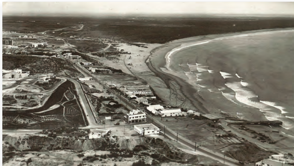
Agadir (Maroc), années 1930 (AMBC, 60 NUM 6 – don de Serge Verheylewegem).