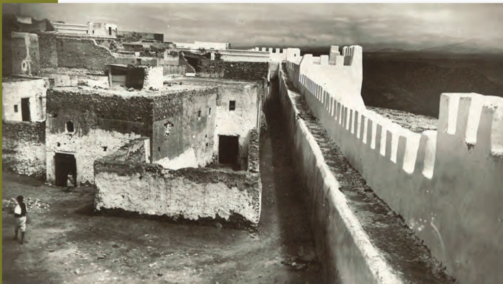
Agadir (Maroc), années 1930.