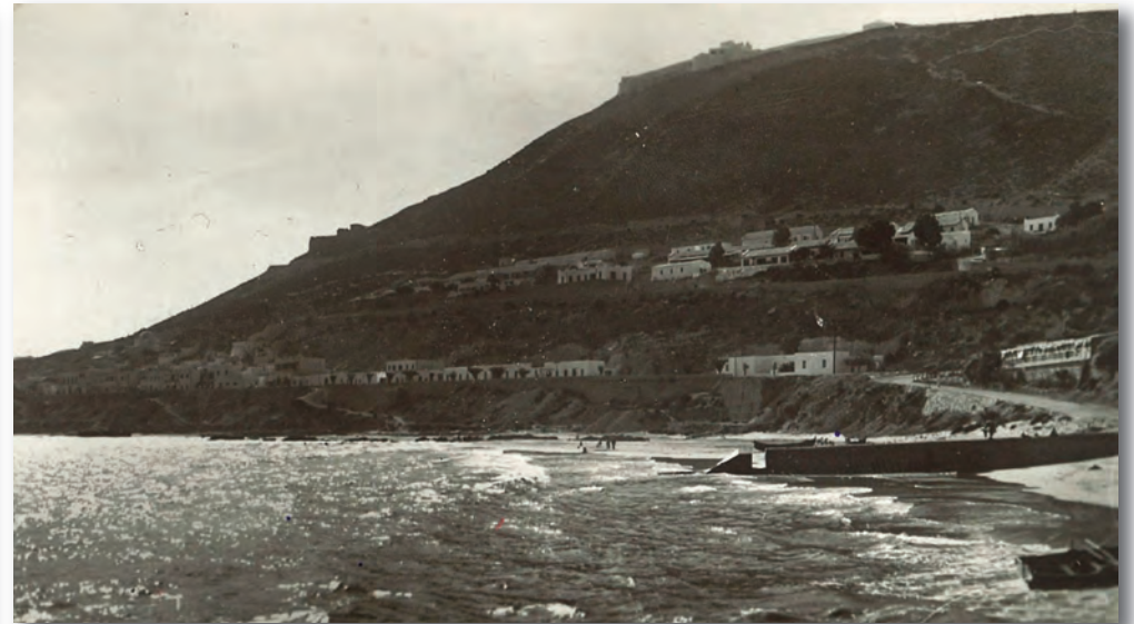
Agadir (Maroc), années 1930.