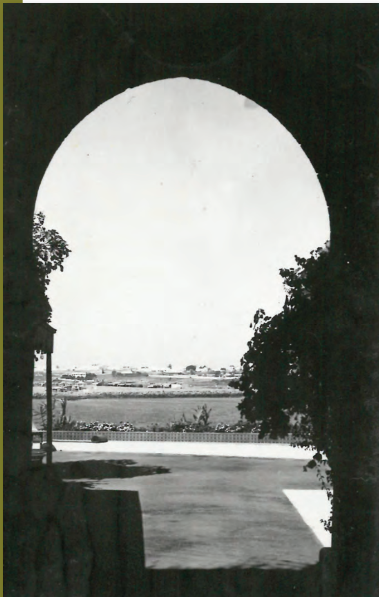
Rabat (Maroc), 1934 (AMBC, 60 NUM 23 – don de Serge Verheylewegem).