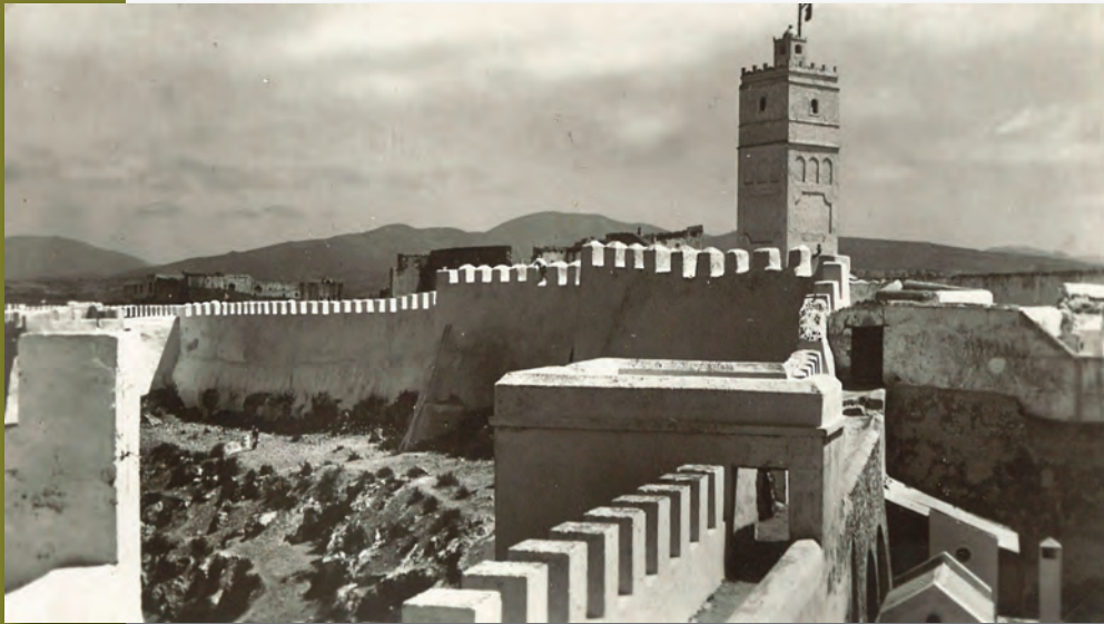
Agadir (Maroc), années 1930.