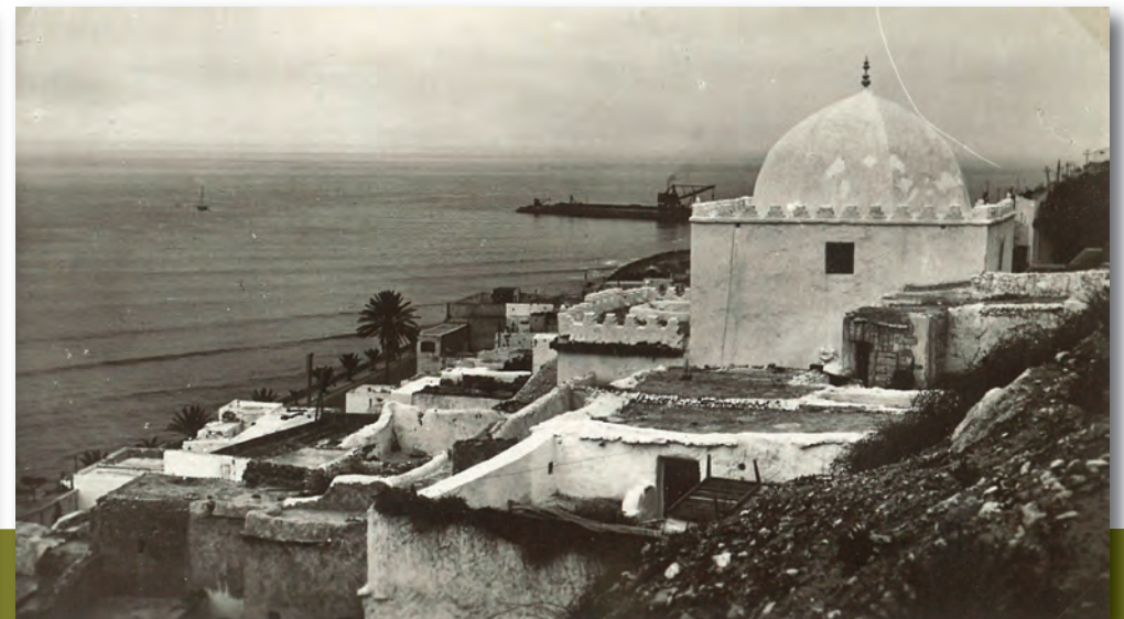
Agadir (Maroc), années 1930.