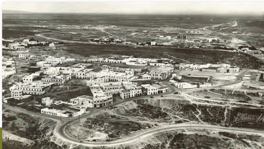
Agadir (Maroc), années 1930 (AMBC, 60 NUM 6 – don de Serge Verheylewegem).