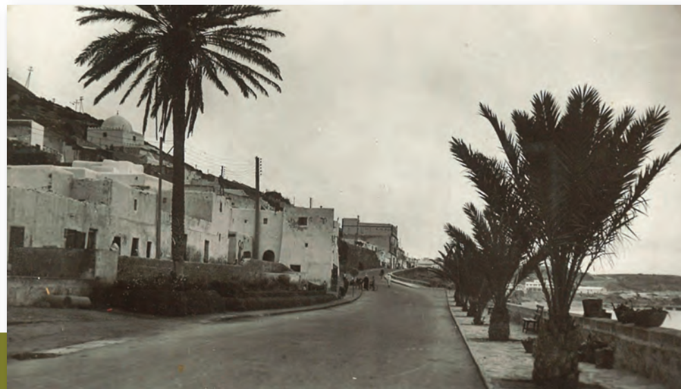
Agadir (Maroc), années 1930 (AMBC, 60 NUM 6 – don de Serge Verheylewegem).