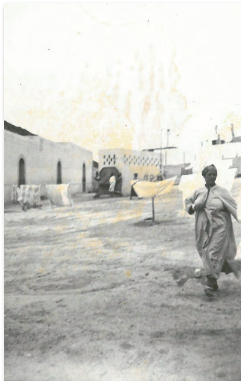
Agadir (Maroc), 1934 (AMBC, 60 NUM 6 – don de Serge Verheylewegem).